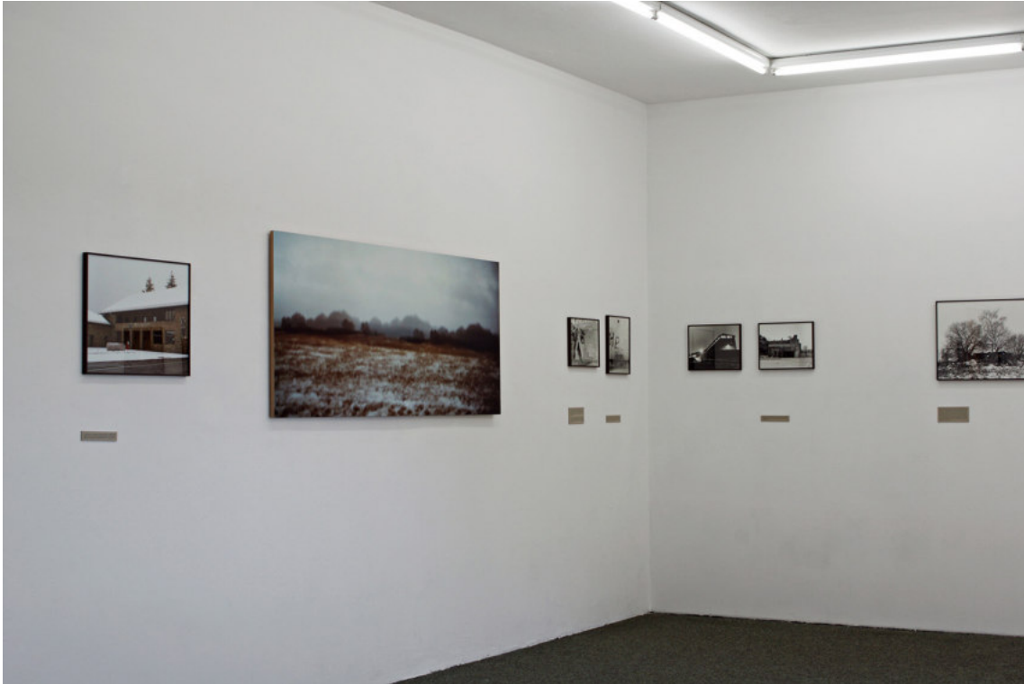
Remembering Landscape , Installationsansicht Bachelorpräsentation, 2017